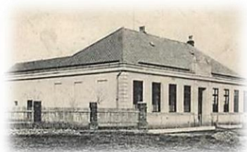
Nová školní budova v roce cca 1915 a 1925