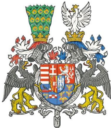
František Ferdinand d' Este (1863 -1914), arcivévoda rakouský a následník trůnu