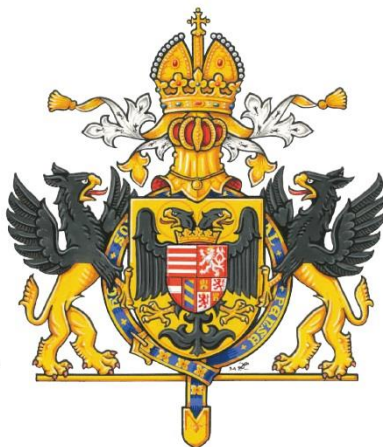
Rudolf II. (1552 – 1612), císař římský, král český a uherský