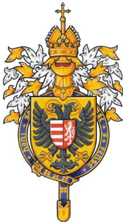
Zikmund Lucemburský (1368 – 1437), císař římský, král český a uherský