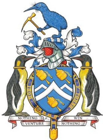
sir Edmund Hillary (1919 – 2008), první pokořitel nejvyšší hory světa – Mt. Everest