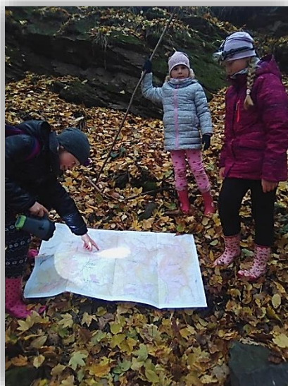
Skalnaté podloží sev. příkopu, resp.jeho vrchní části -valu a někteří členové výpravy