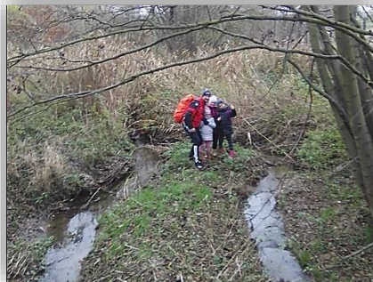
Soutok dvou dnes bezejmenných potoků