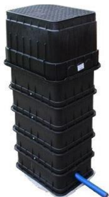
šachta Hutira (cca 60 x 40cm)